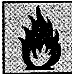
N°2 F - Facilement inflammable

Précautions à prendre lors : De la manipulation de ce produit