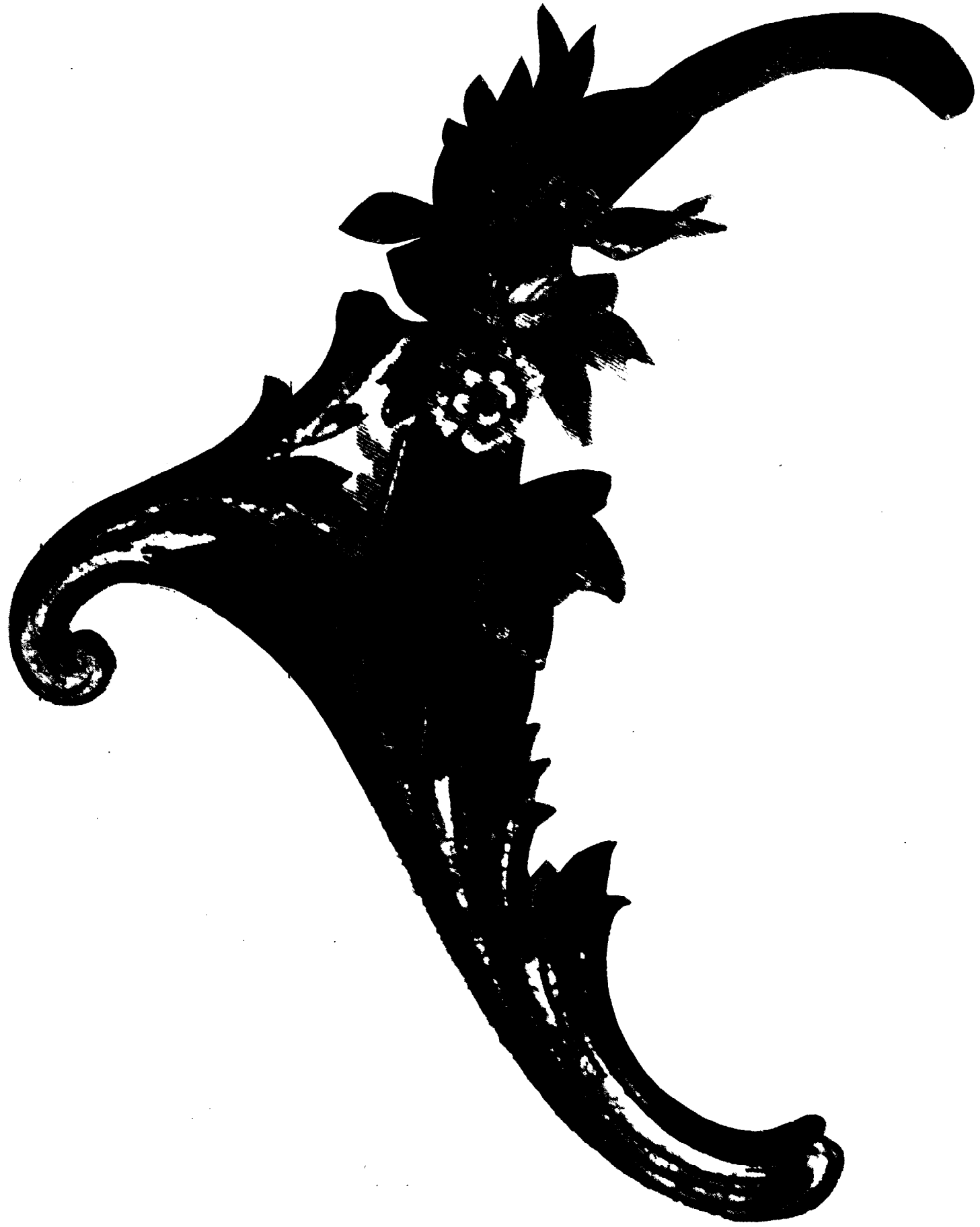
Côté droit existant