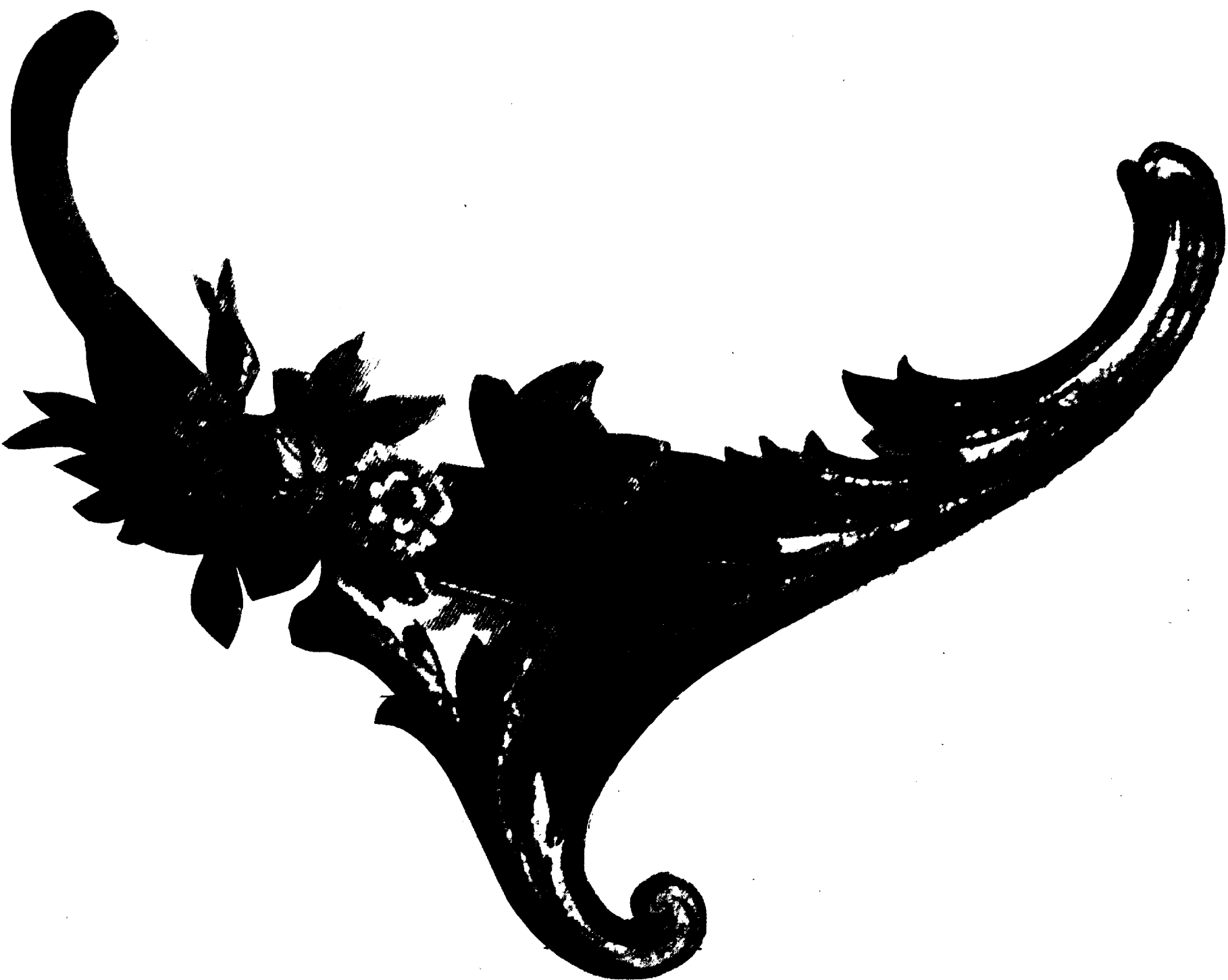
Côté droit existant