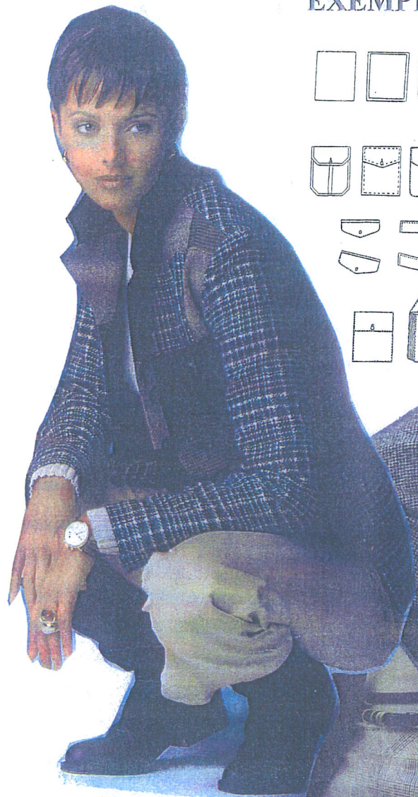
N° 1 2 3 4 Collections HIVER