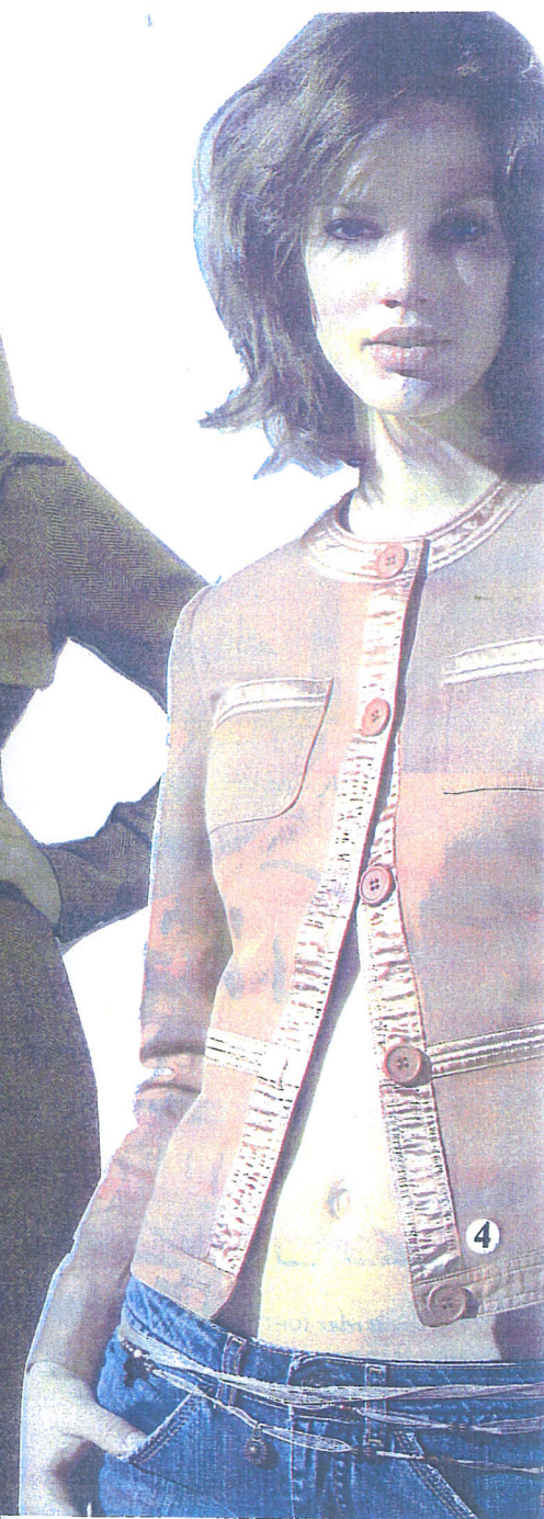
1-Une jupe en « prince de Galles » de la Redoute. 2-Un tailleur en tweed de laine de chez Hermès. 3-Une combinaison-pantalon en laine à chevrons, de chez Max Mara. 4-Une veste en coton et satin de la Redoute.