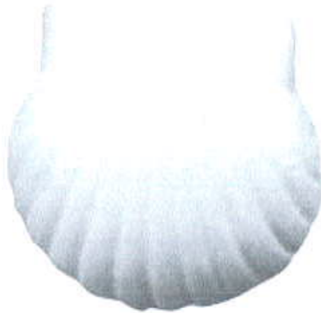
Planche documents 1