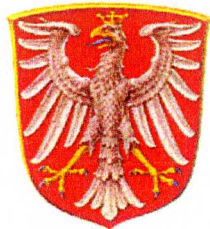
écusson de Francfort.psd

... et une "référence" correspondant à l' image à produire :