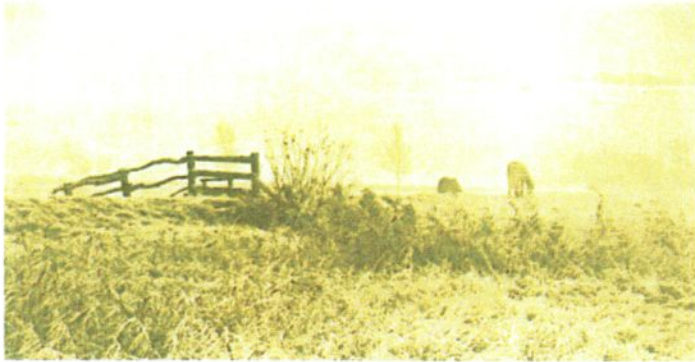
Peter Henry EMERSON Lever de soleil en hiver, vers 1885.