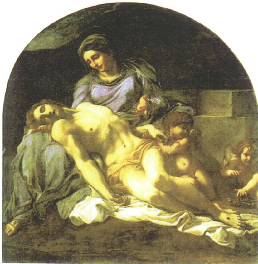
Annibale CARRACHE. La vierge pleurant le Christ , 1599-1600. Retable, huile sur toile.