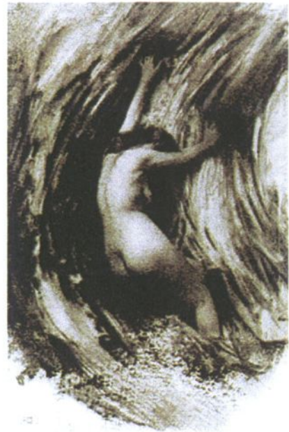
Robert DEMACHY Lutte, 1904.