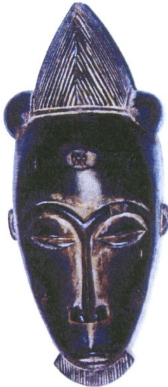
Doc 5 : Document de référence Masque Baoulé, côte d'Ivoire.