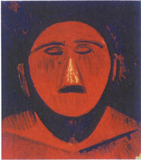
Doc 1 : "La fermière" (détail) de P. Picasso, 1919.