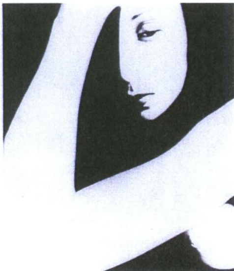
Doc 3 : Photographie de Bill Brandt 1952