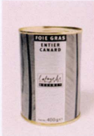
Packaging pour du foie gras