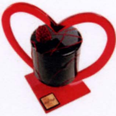
Packaging pour des chocolats