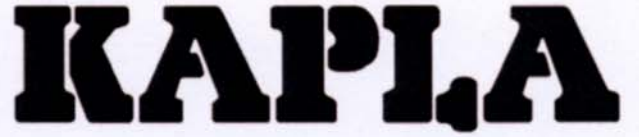
Logotype sur fond blanc