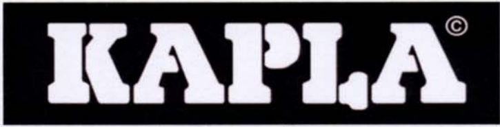
Logotype en réserve