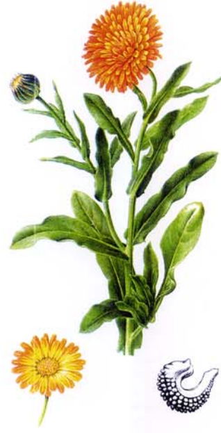
Souci officinal Calendula officinalis L.