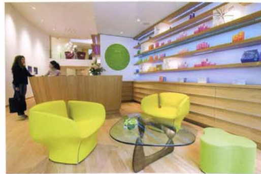
Sol en chêne, peinture écologique sur les murs.