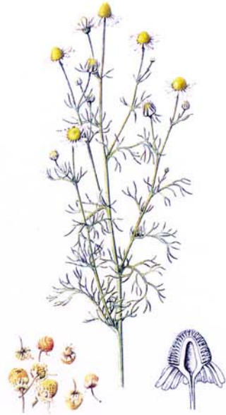
Camomille allemande Chamomilla recutita (L.) RAUSCH. (syn.: Matricaria chamomilla L.)