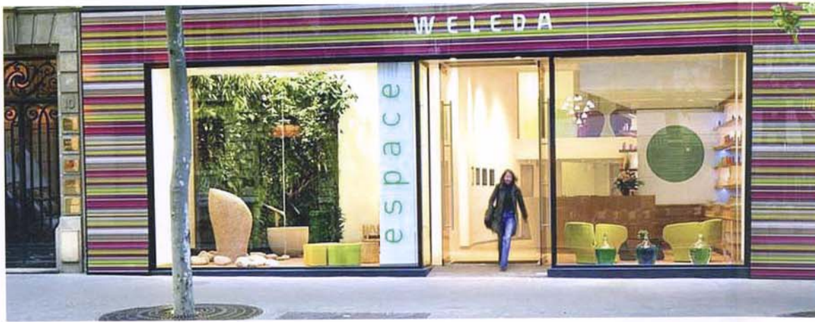
La façade bayadère (à rayures) mise en couleur par Blandine Lelong.