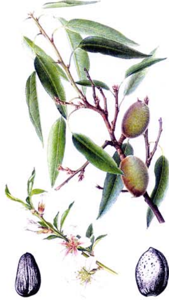
Amandier commun Prunus dulcis (MILL.) D.A.WEISS (syn.: Amygdalus communis L.)