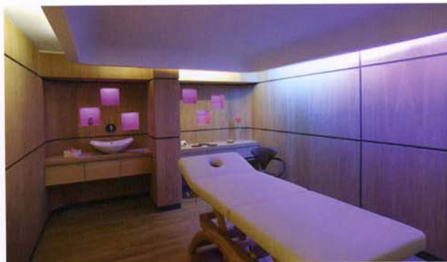
Un salon de massage.

L'ESPACE WELEDA Paris, 2006 architecte : Maryam Ashford-Brown