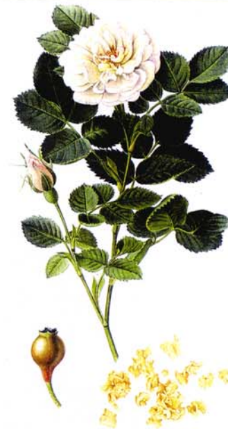
Rose cent-feuilles Rosa centifolia L.