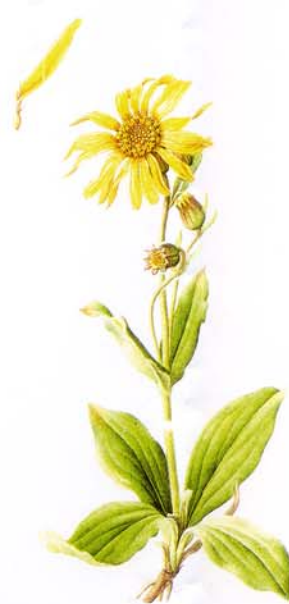
Arnica des montagnes Arnica montana L.