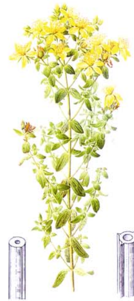
Millepertuis officinal Hypericum perforatum L.