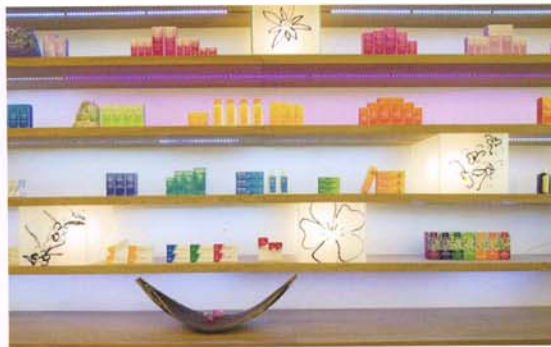
Étagères en bois massif et boîtes lumineuses en verre sablé (dépoli) de Ianna Andreadis.