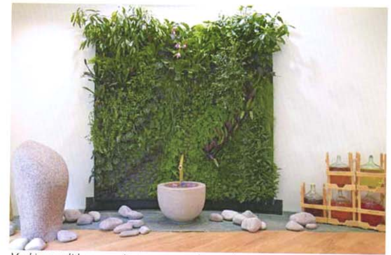
Menhir monolithe en granit et vasque en grès rose du sculpteur Yann Grégoire. Mur végétal vivant du botaniste Patrick Blanc.