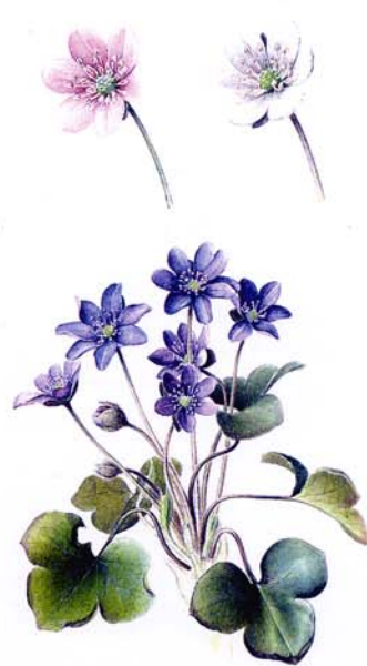
Hépatique Hepatica nobilis SCHREIB.