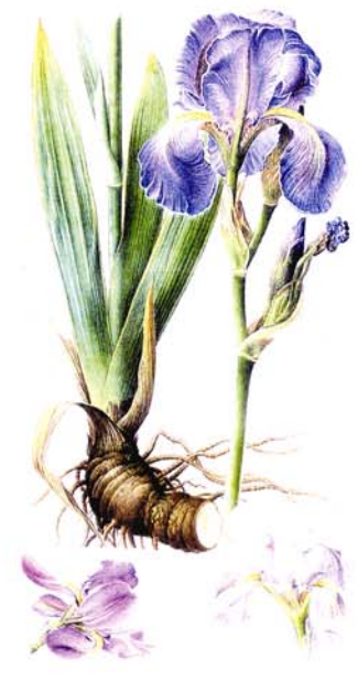
Iris commun Iris germanica L.