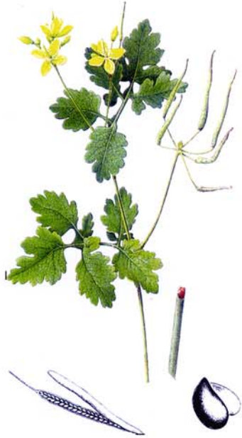
Grande chélideine Chelidonium majus L.