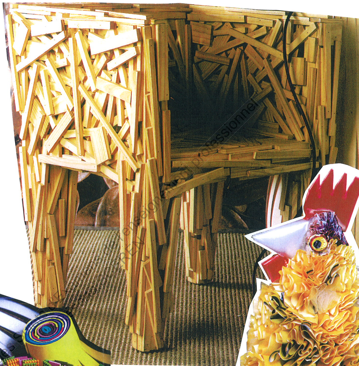
"Favela", design Fernando et Humberto Campana, un fauteuil réalisé à la main à partir de petits morceaux de bois récupérés et collés entre eux.