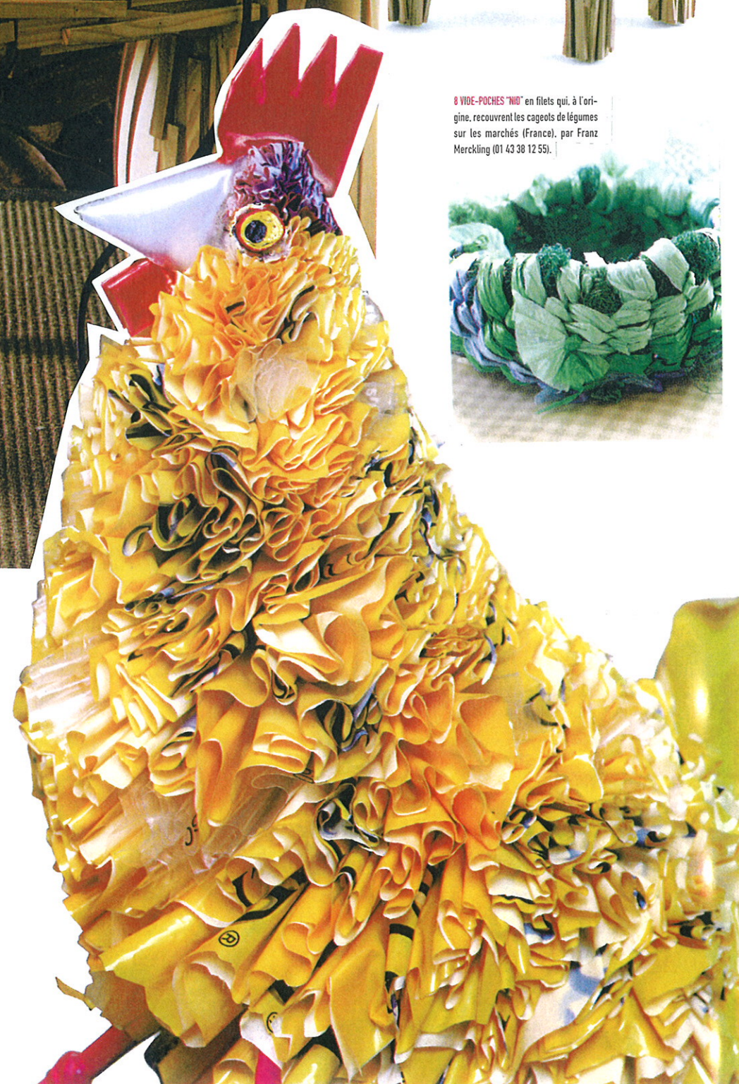
POULE (page de gauche) en sacs plastique recyclés, réalisée dans l'un des plus grands ghettos du Cap (Afrique du Sud). Chez Nature et Découvertes