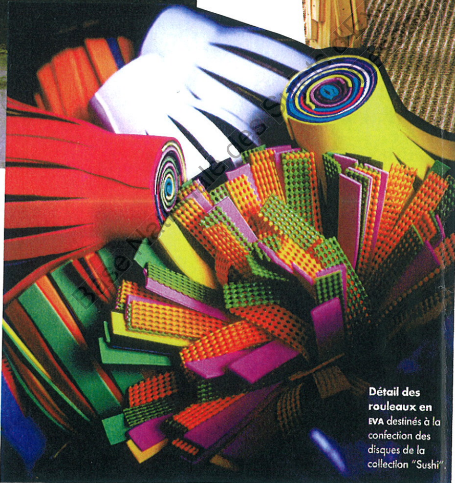
Détail des rouleaux en EVA destinés à la confection des disques de la collection "Sushi".