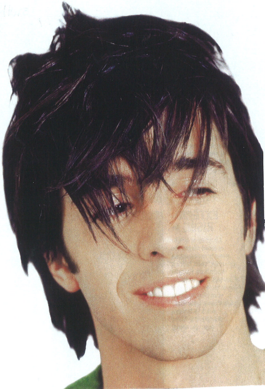
Arthurro après Défrisage