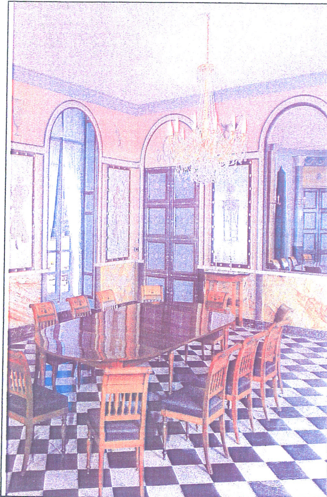
Salon en projet

1. Citer 2 critères de qualité du sanglage :