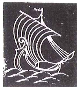
HERGÉ « Tintin »