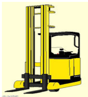
Chariot élévateur à mât rétractable