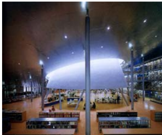
Mecanoo , Bibliothèque centrale, Université technique de Delft, 1993-98.