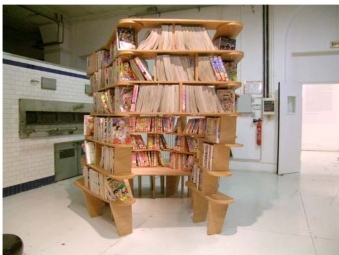
Coin lecture, à l'entrée de l'exposition Archilab 2006 .