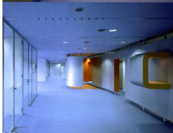
Dekkers , Bureaux aux Pays-Bas, 2005.