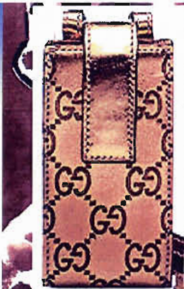
< Gucci_pochette pour téléphone portable