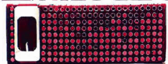
Gucci_«Bianca»_sac de soirée