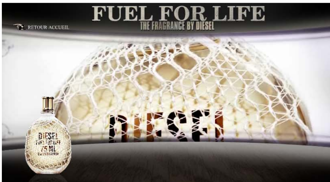
Sources : 3 captures d'écran du site internet.