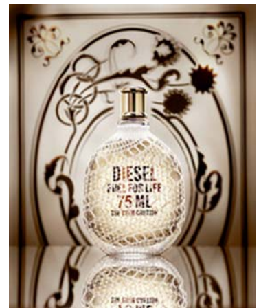
Deux visuels magasin.