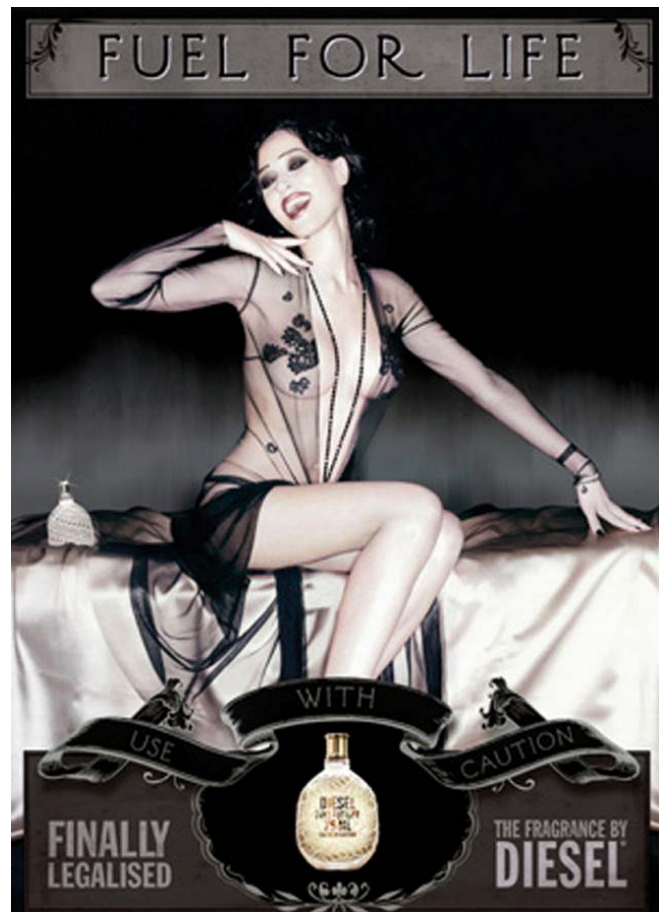
Trois annonce presse.