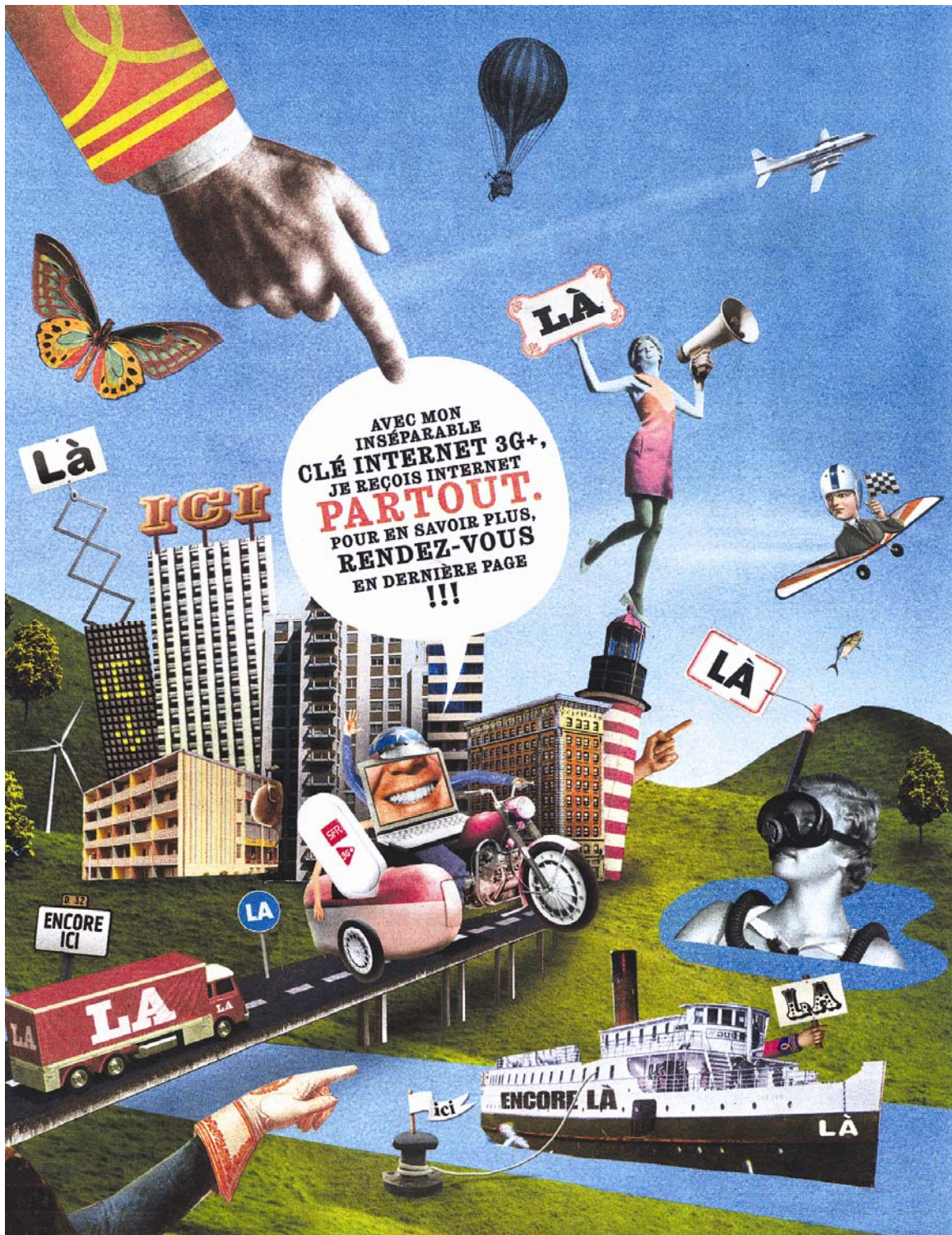
Annonces presse parues en pages intérieures du journal gratuit Métro.