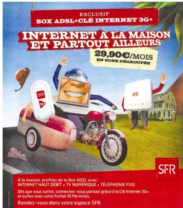
Annonces presse parues en 1 re et 4 e de couverture du journal gratuit Métro.