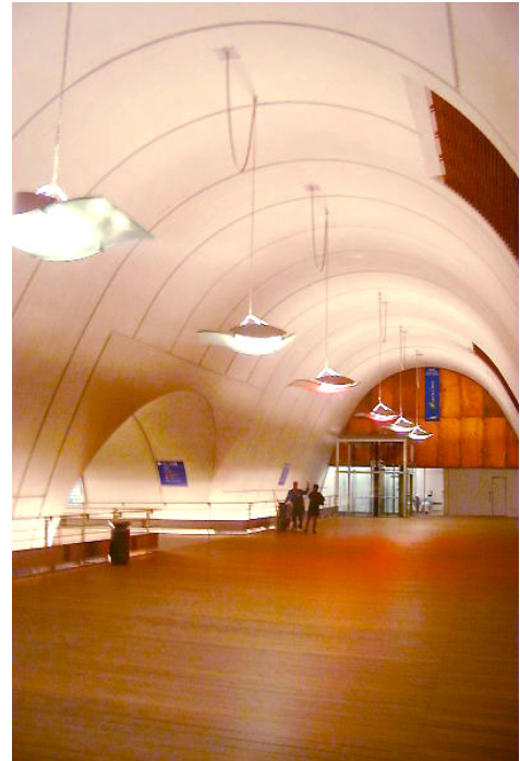
Exemples de lieux d'intervention : Gare Saint- Lazare (ci-dessus) et métro parisien, inter-station ligne 14 (ci-contre)