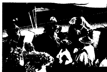
Port de Mopti

Jour 6 : Départ pour Mopti et visite de la Venise malienne : le marché, le port, la fabrique de pirogues, de poteries, la mosquée Komoguel. Balade en pirogue sur le Bani, à la rencontre des villages de pêcheurs bozos. Repas et nuit à l'hôtel à Mopti (Sévaré).