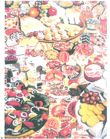
5. Errö «Foodscape» (extrait) - 1962 200 x 300 cm