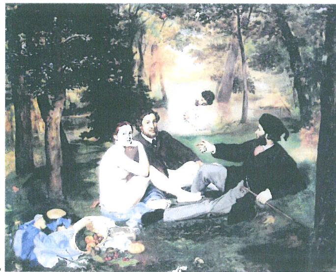
7. Manet «Le déjeuner sur l'herbe» - 1862-1863 - 208 x 264,5 cm