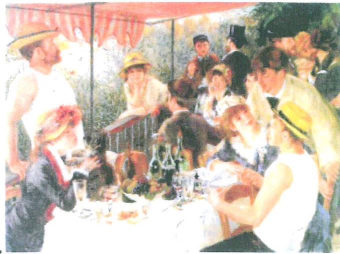
2. Renoir «Le déjeuner des canotiers» 1880-1881 130 x 173 cm