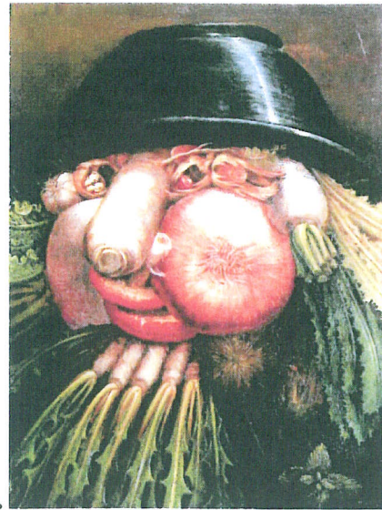
1. Arcimboldo «Le Jardinier» 1590 35 x 24 cm