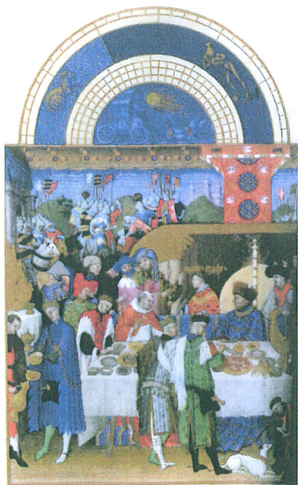
10. Les frères Limbourg «Janvier» - 1416