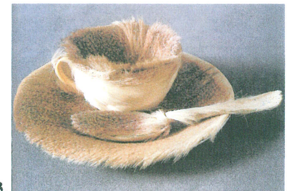
13. Oppenheim «Le déjeuner en fourrure» - 1936