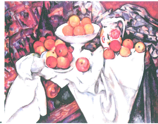
4. Cézanne «Pommes et oranges» - 1895 - 93 x 74 cm