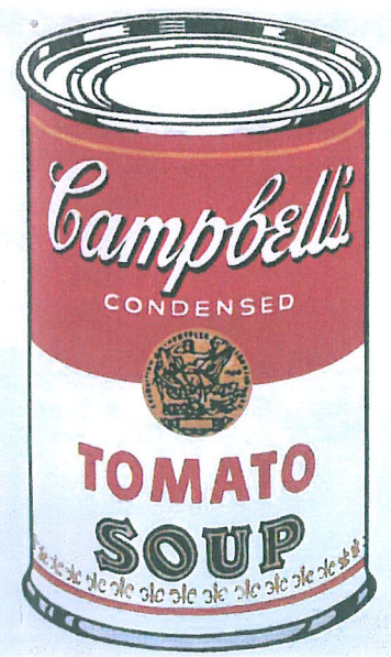
3. Warhol «Campbell's soup cap» - 1964 50 x 40 cm