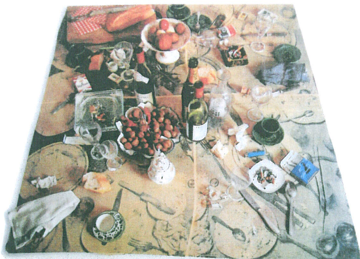
11. Spoerri «Repas hongrois» - 1963 - 103 x 205 x 33 cm