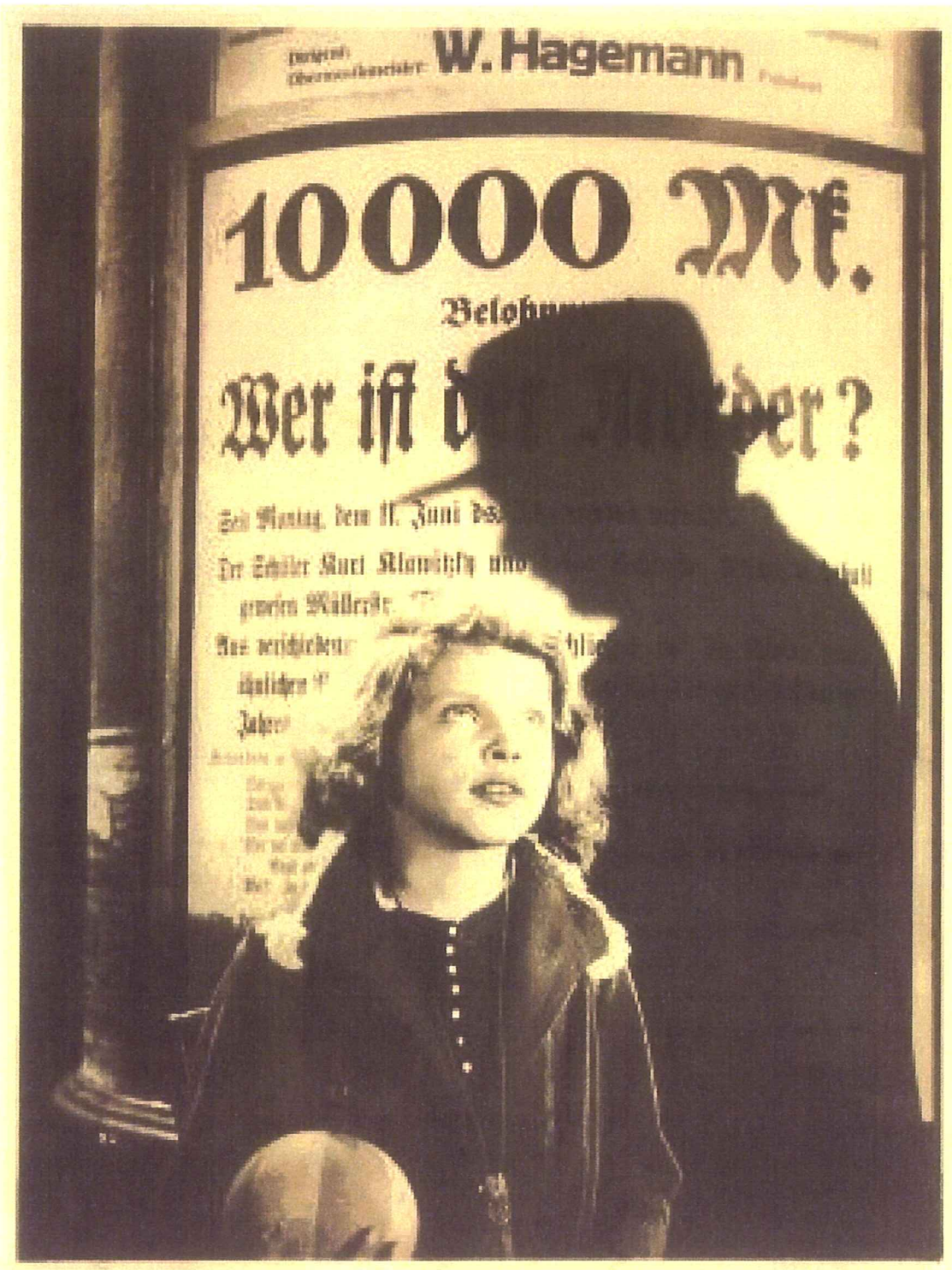
Fritz LANG , M. le maudit, 1931