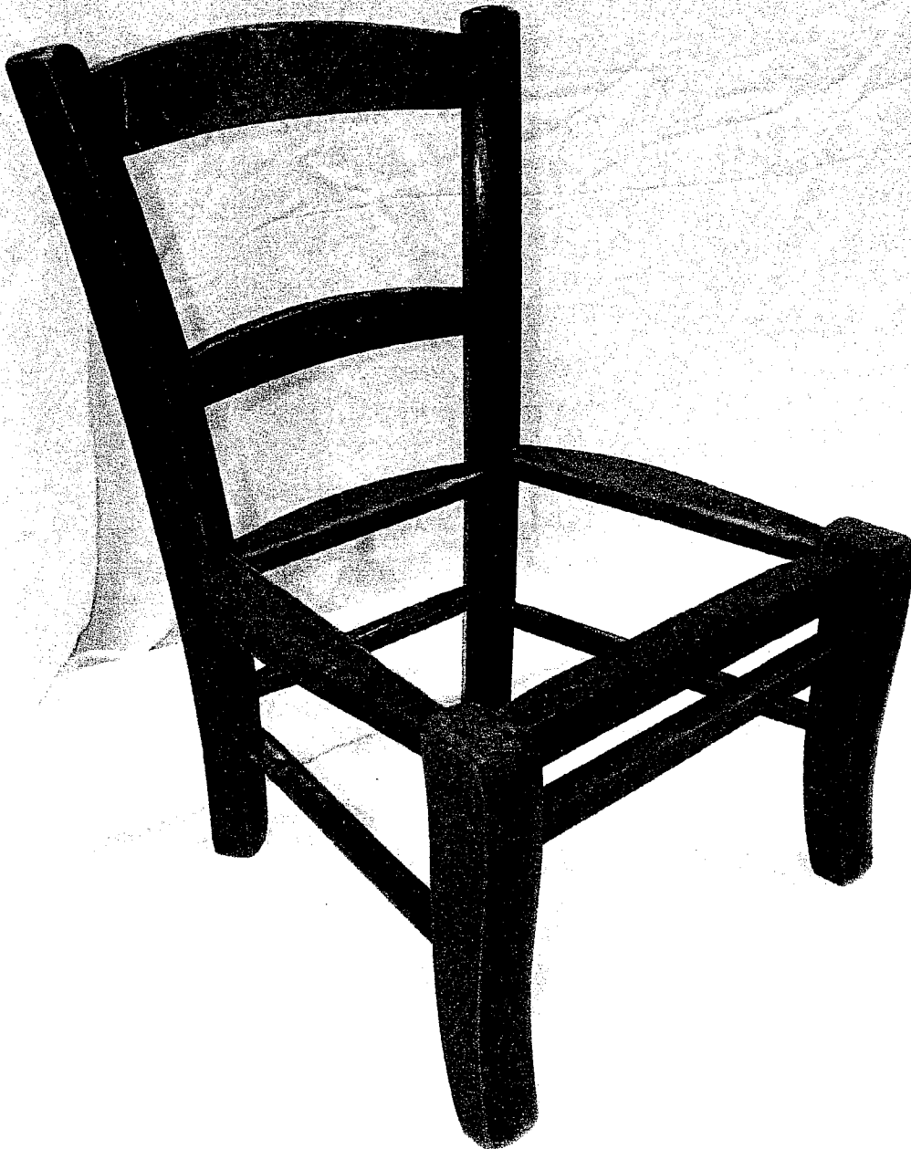
Chaise basse d'enfant