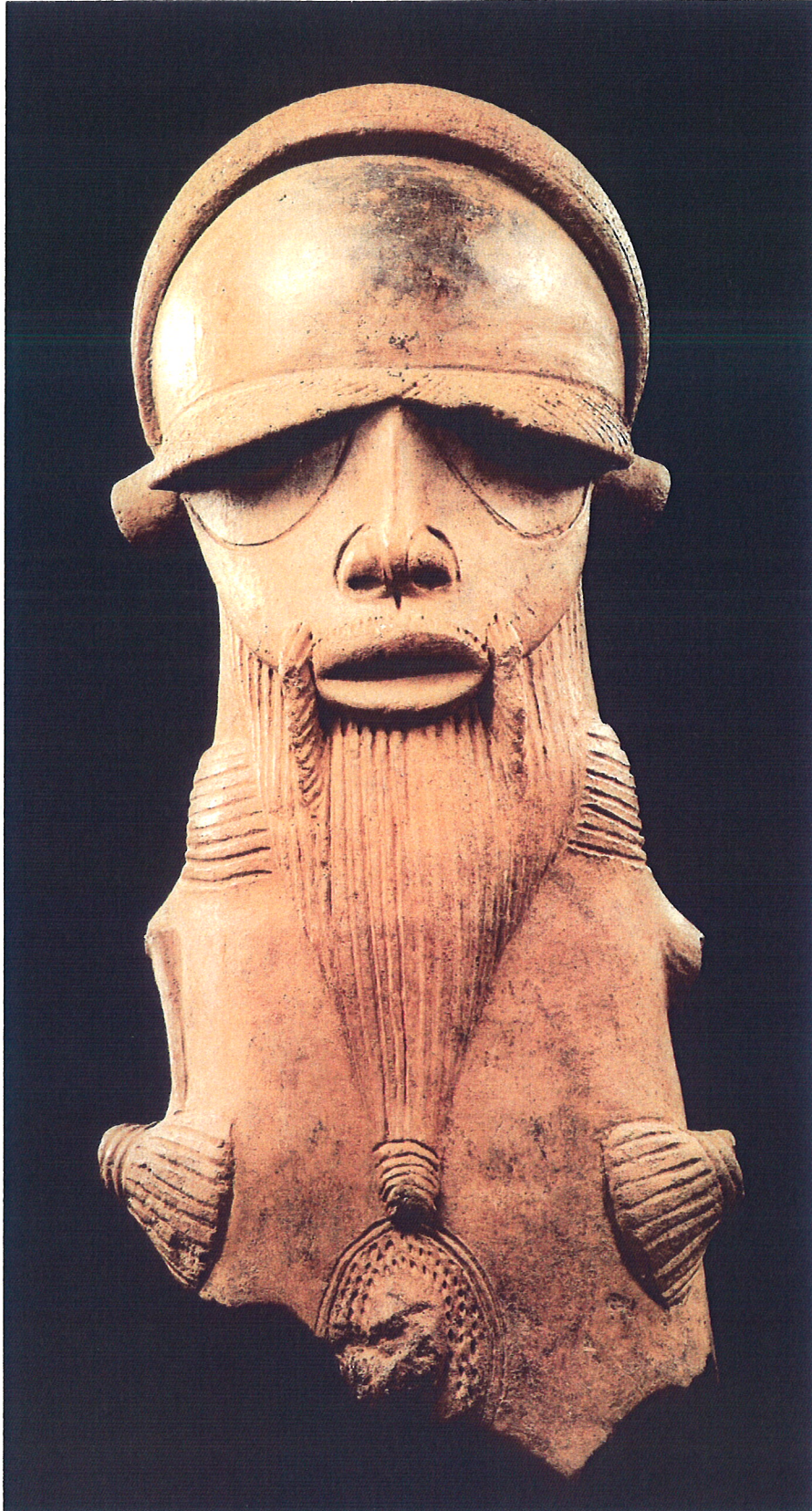
BUSTE MASCULIN SOKOTO AFRIQUE 50 ap J.C. +/- 200 ans.