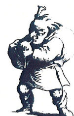
Joueur de cornemuse