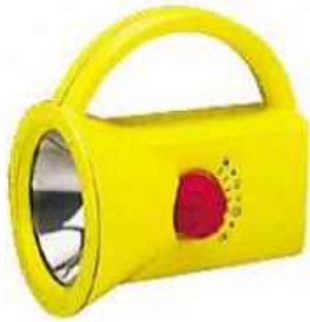
Lampe torche multi effets. Eveil et jeux. Lumière blanche, rouge ou verte, flash ou clignotant. Dimensions: 16 x 11 x 16 cm. Nécessite 2 piles LR14. Prix: 14 Euros.