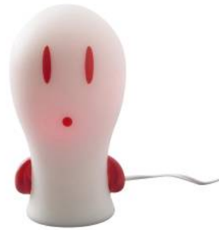
Veilleuse Sköpa de Bodrul Khalique, IKEA. Hauteur: 13 cm. Reste allumée pendant 4-6 heures si la batterie est entièrement chargée. A partir de 3 ans. Diodes lumineuses. Durée de vie : environ 50.000 heures. Transformateur/chargeur inclus. Corps: polypropylène. Surtmoulage en silicone. Prix : 12,95 Euros.