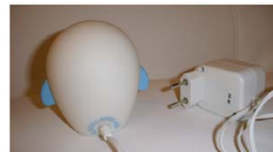
Composants techniques de la veilleuse Sköpa