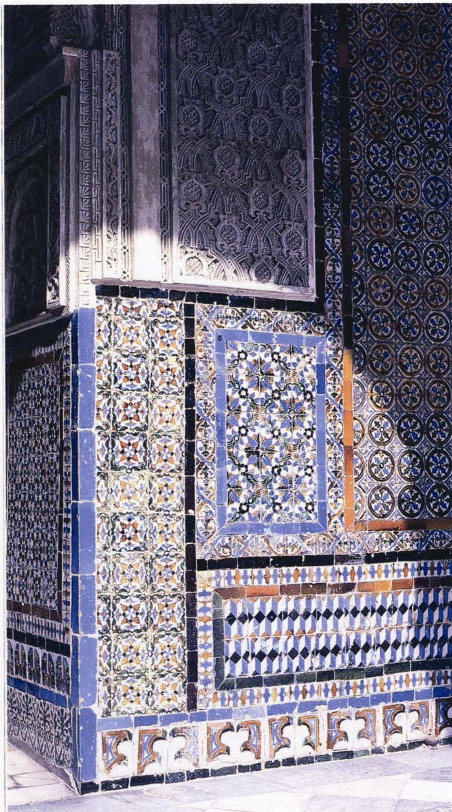
DOCUMENT 1 : Détail d'un mur orné de carreaux dans le patio central de la maison de Pilate à Séville datant du début du XVIe S.