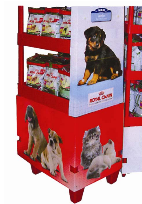
Vue arrière du pilier gauche de la base