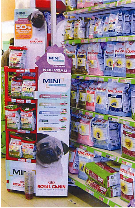
Présentoir et linéaire