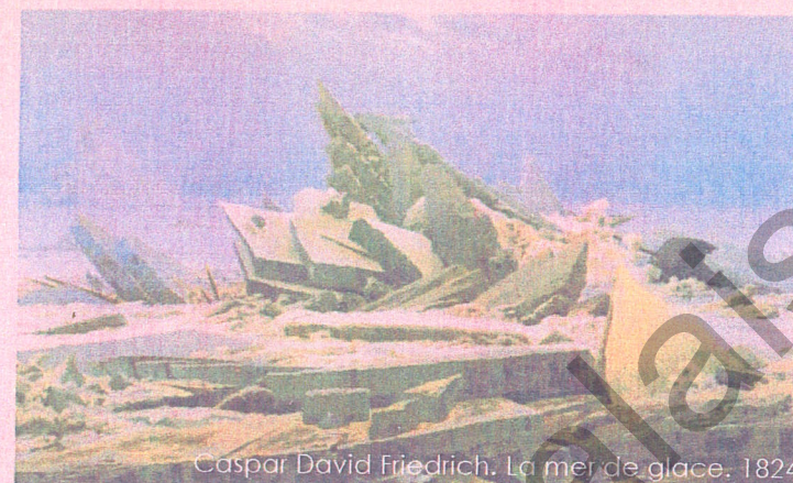
Caspar David Friedrich. La mer de glace. 1824