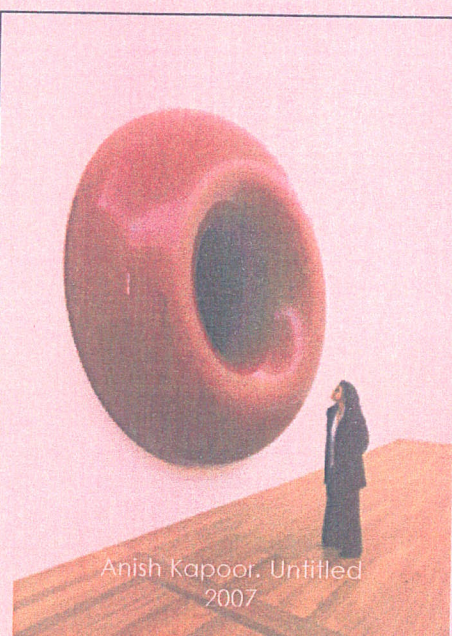
Anish Kapoor. Untitled 2007