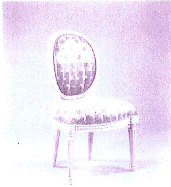
Chaise médaillon en cabriolet Style Louis XVI, XVIIIème siècle