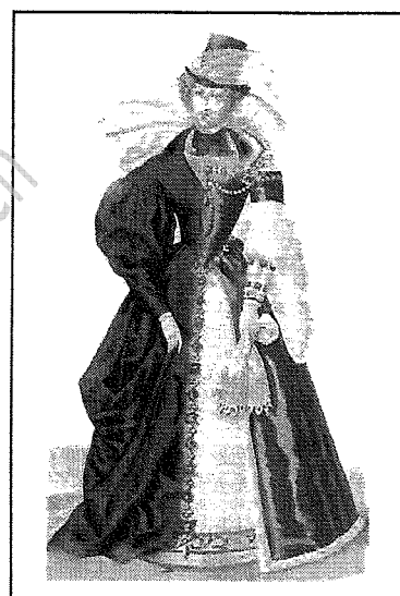
XIXe siècle / Renaissance