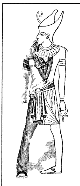
XXe siècle / Egypte