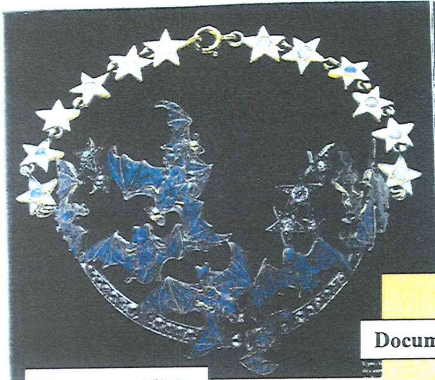
Document N° 2