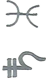
Symboles de l'arbre

A B C D E F G H I J K L M N O P Q R S T U V W X Y Z