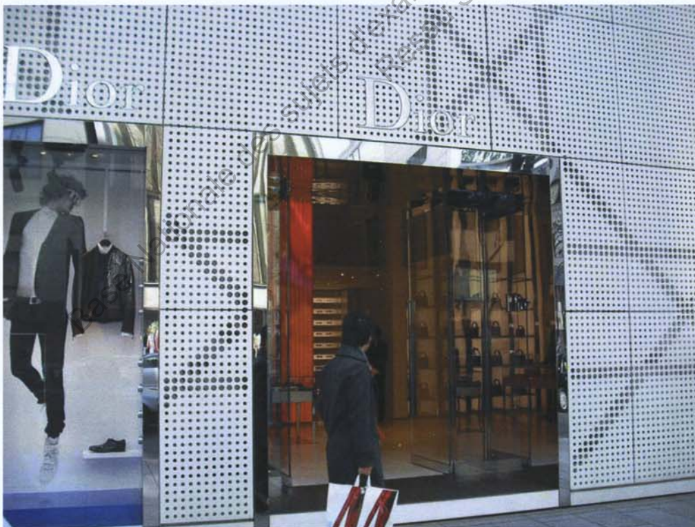
Boutique Dior Ginza à Tokyo