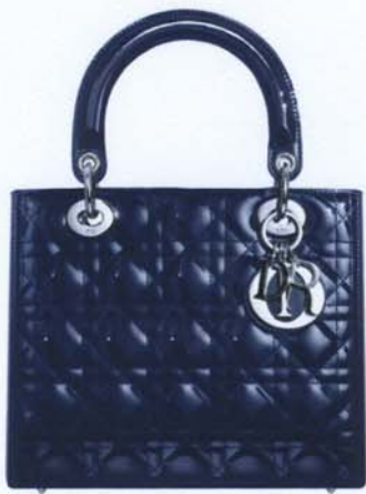
Sac en agneau matelassé noir surpiqûres « cannage ». Bijouterie lettre D I O R en métal argenté. À l'intérieur une poche zippée Dimensions : 24 x 20 x 11 cm