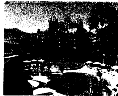
Balnéothérapie - SPA Hôtel "Hôtel Botanico" S.A. - Ténérife

Balnéothérapie pureté anti-stress 2 j. et plus. Besoin d'une pause anti-stress loin du tumulte quotidien ? L'hôtel Botanico à Ténérife Vous accueille pour un séjour Spa des plus authentiques.