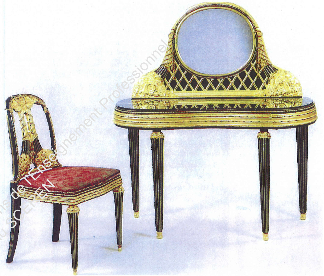
Paul FOLLOT – 1920 Chaise et coiffeuse en bois laqué, motifs sculptés et dorés.