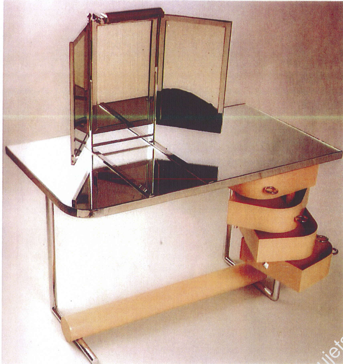
René HERBST - 1933 Coiffeuse Métal, métal peint, miroir coulissant sur rails.