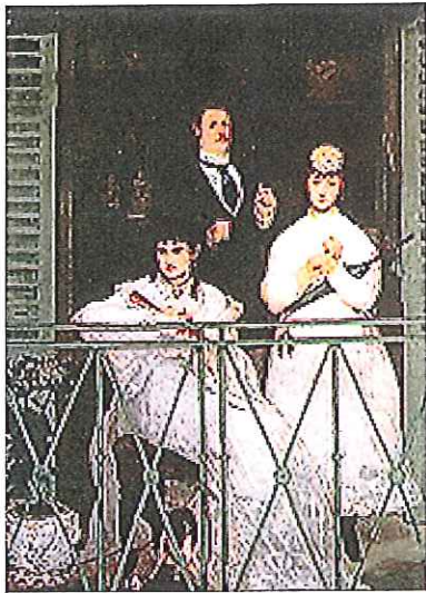
D : Le balcon