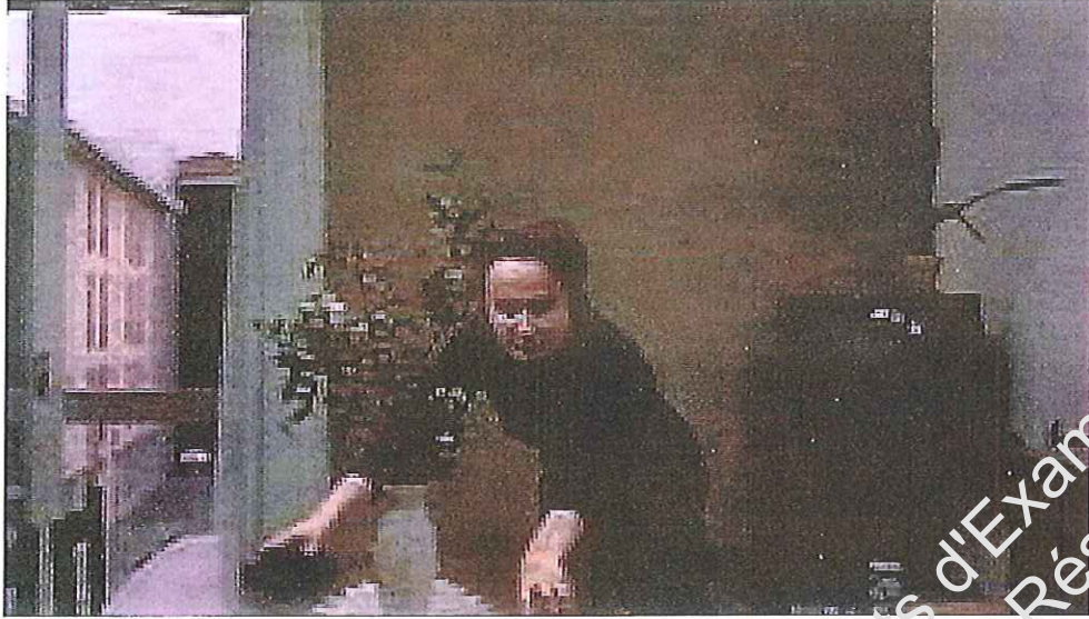
Le désert rouge – Michel Angelo ANTONIONI