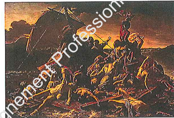
C : Le radeau de la Méduse