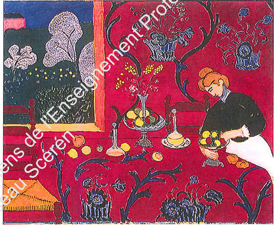
La desserte rouge – Henri MATISSE, 1908