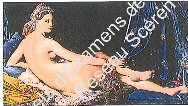
E : La grande Odalisque