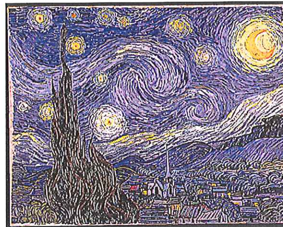
H : Nuit étoilée