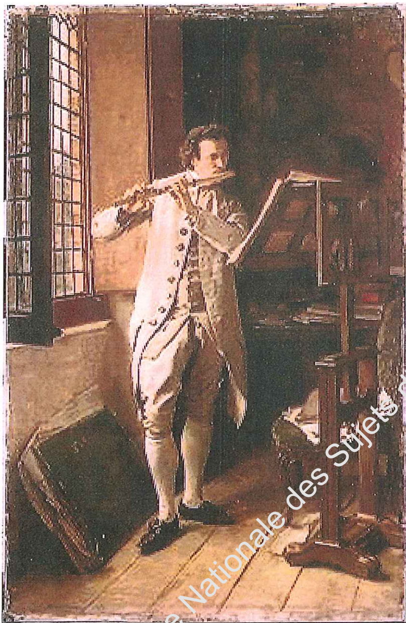
"Joueur de flûte"- Jean-Louis-Ernest MEISSONIER