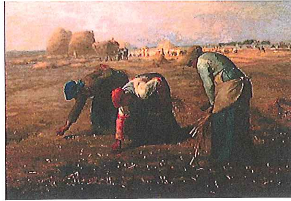
B : Les glaneuses