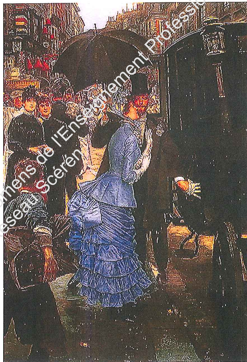
Les voyageurs – James Jacques TISSOT