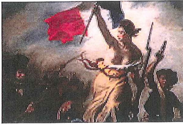
A : La liberté guidant le peuple