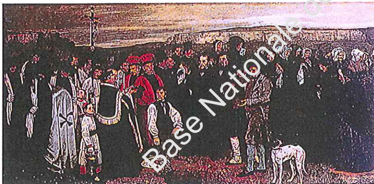
G : L'enterrement à Orans