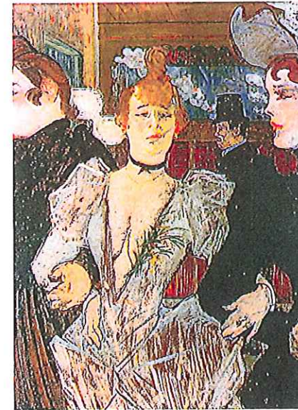
F : La gouleue arrivant au moulin