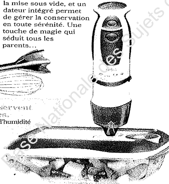
Publicité parue dans un magazine en 2009.