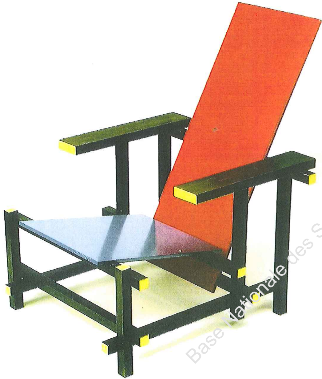
Le fauteuil rouge et bleu , Hêtre laqué, 1918.