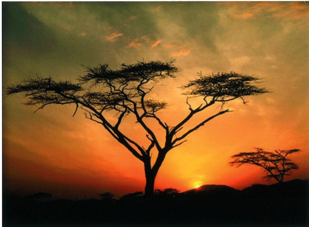
Photographies "paysages d'Afrique" ▲A ▼B