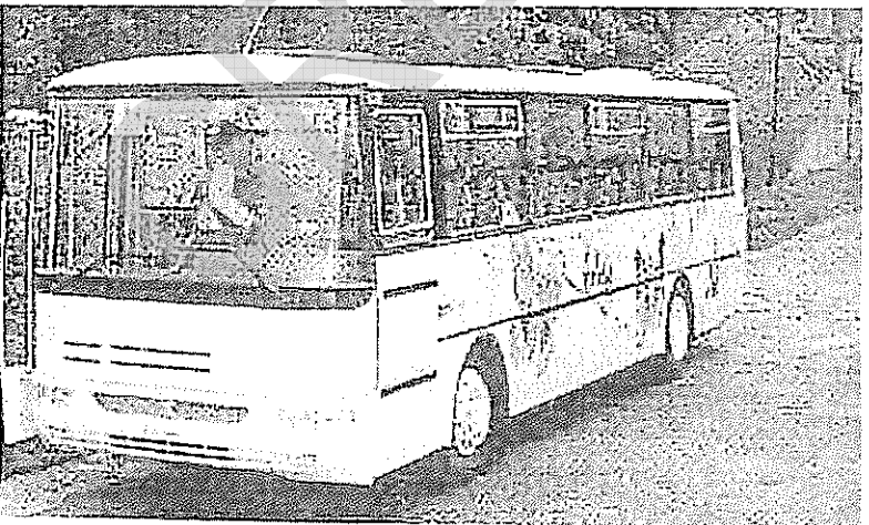
Véhicule C : Karosa Recreo 52 places assises