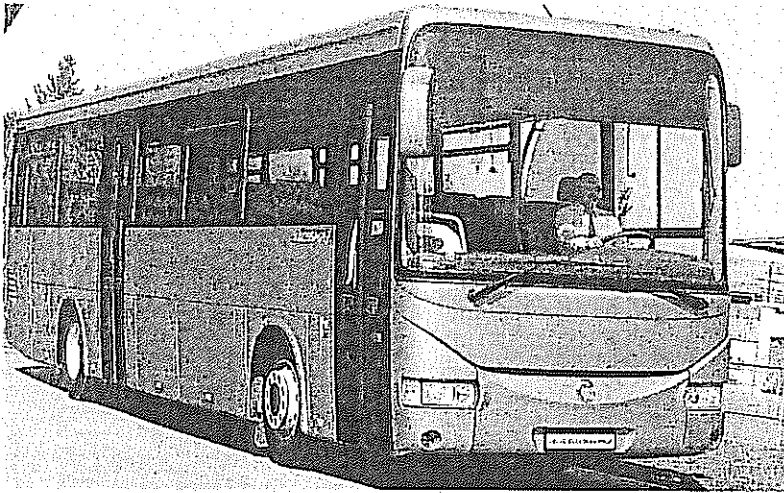
Véhicule A : Irisbus Crossway 54 places assises