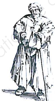
Très gros mendiant