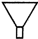
Boîte à lumière