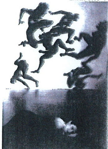
Cie Vertigo - « De gamme en gammes » Dunois