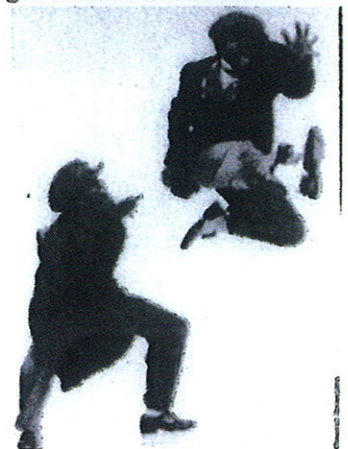
Collectif « Jeu de jambes » Festival de La Villette 2003