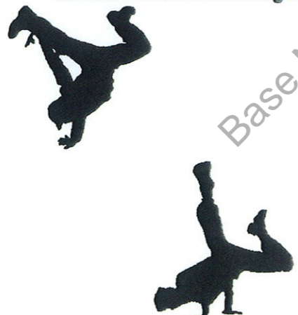
Deux danseurs Hip hop

Danse urbaine, le Hip hop est né dans les rues de New York des années 80.