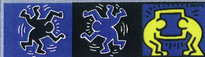
Extrait du livre pour enfant "DANCE" page 3 KEITH HARING - 1986/88

Les artistes peintres au 20 ème siècle ont souvent cherché passionnément à exprimer l'écriture des corps en mouvement, modelés par les rythmes nouveaux :