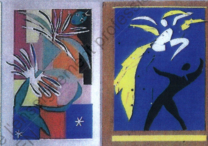
« Danseuse créole » H. MATISSE - 1950 - « Deux danseurs » H. MATISSE - 1937/38