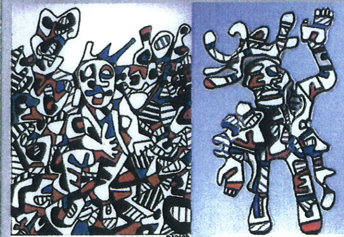
« Site à l'homme assis » J. DUBUFFET - 1973 - 178x140cm. « Bal costumé » J. DUBUFFET - 1978 H. 82 x L. 51 x P. 18 cm