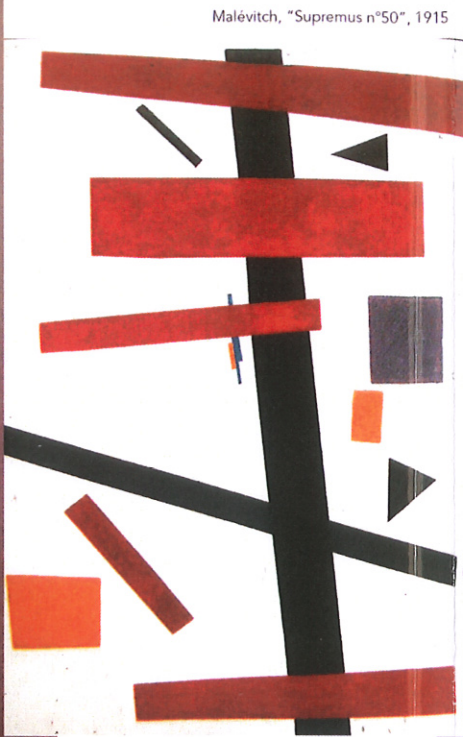
Malevitch, "Supremus n°50", 1915