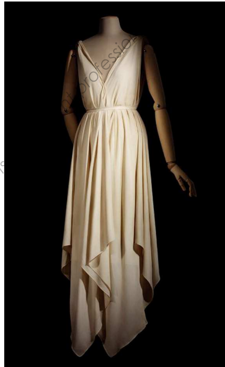
SÉRIE B Document 2 Madeleine VIONNET Robe quatre mouchoirs, 1920.