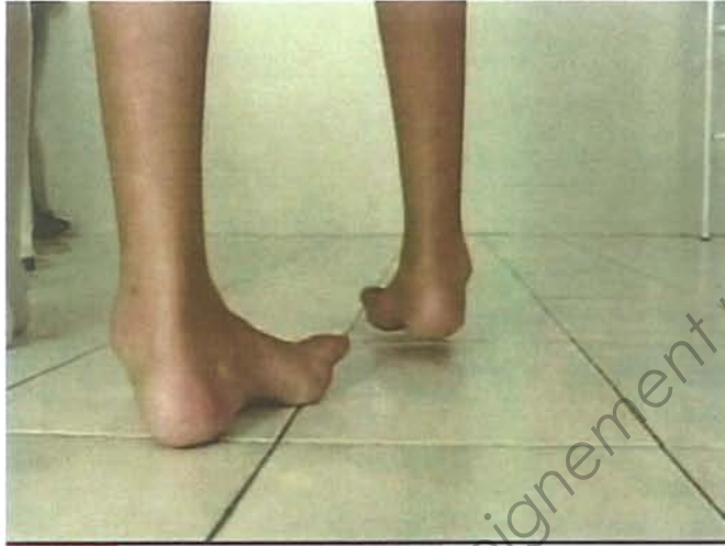
Attitude varisante des pieds durant la marche