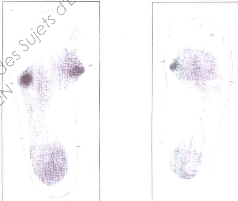
Empreintes de la patiente