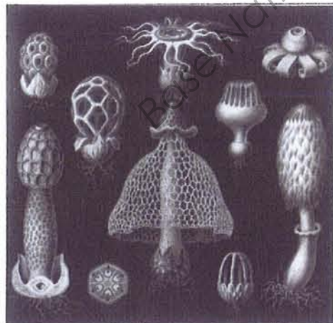
morphologie générale des organismes d'Ernst Haeckel

Gaudí puise ses sources dans le monde de « la morphologie naturelle », empruntant ses formes aux protozoaires, radiolaires ou méduses à travers une architecture stylisée à tendances médiévales ou orientales.