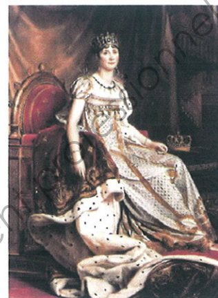
Joséphine De Beauharnais