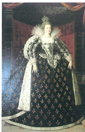
Marie De Médicis